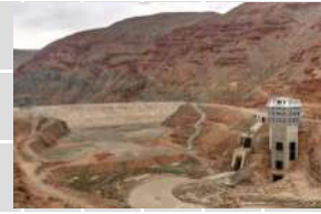
سد شهید مدنی (ونیار) - تبریز

پاوان شرکت ساختمانی (سهامی خاص) PAVAN construction co.